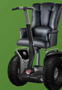
https://www.pinterest.de/pin/211598882467686106/ [letzter Abruf: 15.07.2019]