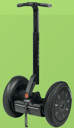
http://www.segway-citytour.de/segway_se.gif [letzter Abruf: 01.08.2016]