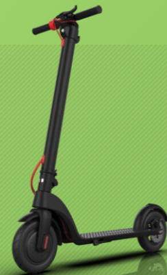
https://nuevotix.com/de/produkt/stadtbesteselbstausgleich-chopper-elektro-roller/ [letzter Abruf: 15.07.2019]