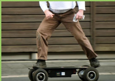
http://img.welt.de/img/niedersachsen/crop151810007/7749731459-ci3x2l-w540/urn-newsml-dpa-com-20090101-160203-99-448852-large-4-3.jpg [letzter Abruf: 01.08.2016]