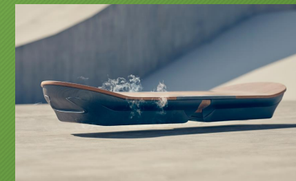
http://global.fnstatic.com/static/managed/img/Leisure/2009/lexus-board-876.jpg [letzter Abruf: 01.08.2016]