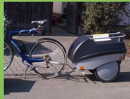
http://www.elektoroller.de/img/leggero.jpg [letzter Abruf: 01.08.2016]