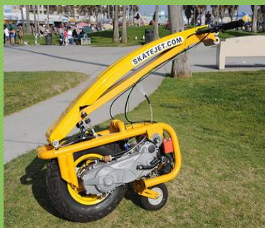
http://farm4.static.flickr.com/3309/4553974966_0389eef5f3.jpg [letzter Abruf: 01.08.2016]