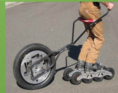
http://3.bp.blogspot.com/-Z33BNPHxEi0/UZxbAkPCdCI/AAAAAAAAAF8A/w3r17Sjc0Sc/s1600/rollercycle.jpg [letzter Abruf: 01.08.2016]