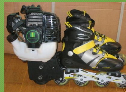
https://artofdesign.files.wordpress.com/2007/03/motorised_rollerblades.JPG [letzter Abruf: 01.08.2016]