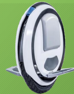
http://hoverboardvergelijken.nl/wp-content/uploads/2015/11/Monowheel-262x300.png [letzter Abruf: 01.08.2016]