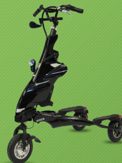
http://www.emotion-flitzer.de/wp-content/uploads/160524_640_Trikke_black.png [letzter Abruf: 01.08.2016]